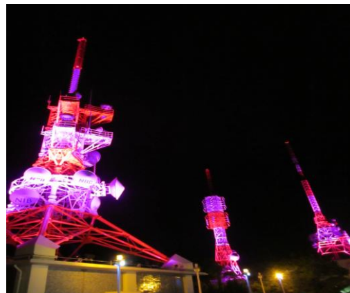
2014 年「光のおもてなし」稲佐山 特別ライトアップの様子